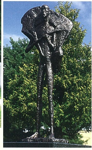
本郷明二作「けものを背負う男」