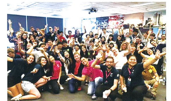
H29シンガポール研修