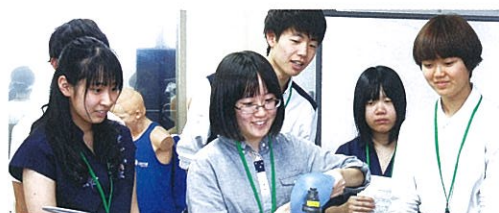
H29旭川医科大学訪問研修