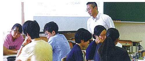
H29札幌西医学セミナー(地域医療に関する探究活動)