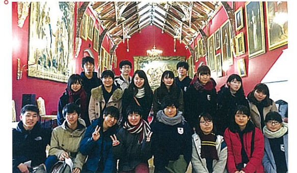
H29アイルランド研修